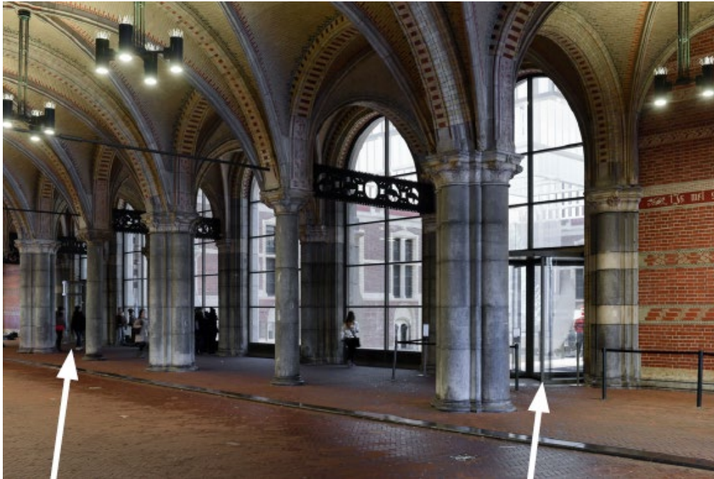
INGANG VIA TRAP

In het midden is het fietspad en aan de zijkanten is de stoep. Vaak fietsen er mensen doorheen en soms zijn muzikanten muziek aan het spelen in de tunnel. In deze tunnel zijn ook de deuren van het museum. Het zijn er vier, drie deuren die bij een trap uitkomen en er is een ingang met een lift. Op deze avond mag je naar binnen via de ingang aan de Westkant van het museum. Die zit hier: